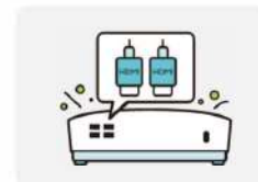
Doble Entrada HDMI