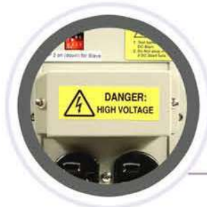
Terminales de salida y alimentación CA de Bornera