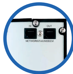
Protección de línea de datos