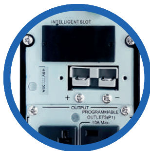
Entrada banco de baterías externas