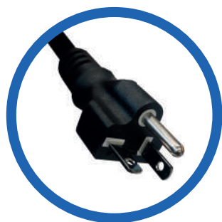
Cable de alimentación CA NEMA 5-20P