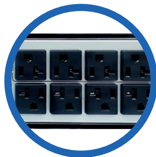
8 terminales NEMA 5 -15R o NEMA 5-20R, de los cuales 4 son programables