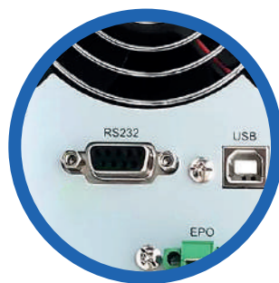
Puertos de comunicación