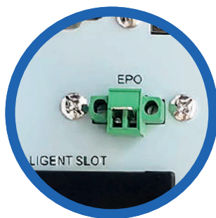
Apagado de emergencia (EPO)