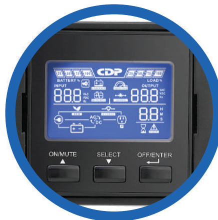
Panel LCD con rotación de 90°