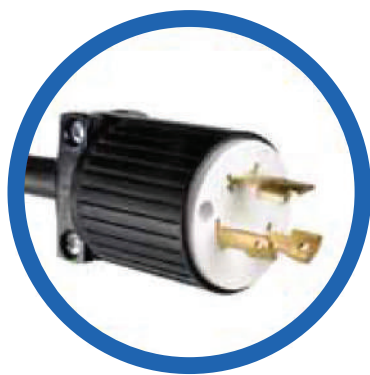
Terminal NEMA L5-30P