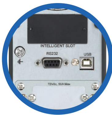
Puertos de comunicación