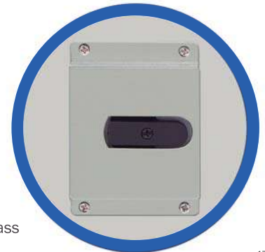
Conmutador de bypass