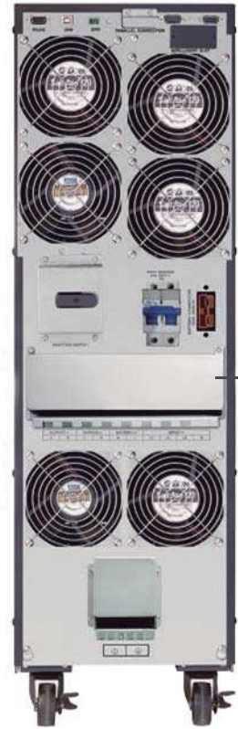
Block de terminales