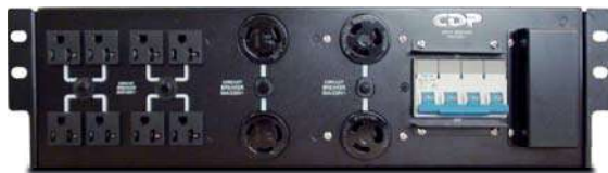
Compatible con unidad de distribución de energía (PDU) se vende por separado