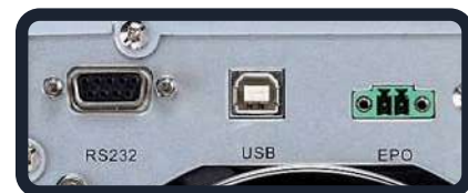
Puertos de comunicaciones externas / apagado de emergencia

· Módulos de potencia que pueden poner en paralelo con la misma capacidad de módulos de hasta 3 veces más un módulo para redundancia N + 1. Por ejemplo, 3 módulos de potencia de 15kVA en paralelo proporcionan 45 KVA, y un módulo 15kva adicional proporciona la redundancia N + 1.