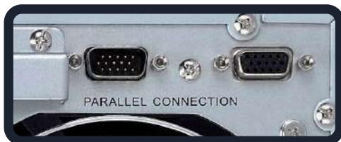
Conexión a paralelo