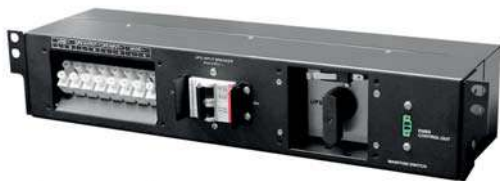
Conmutador de Bypass de mantenimiento