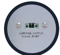
Puerto de control de salida