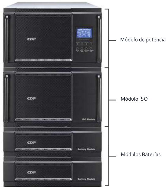
Módulo de potencia