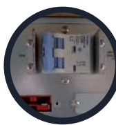
Breaker de baterías