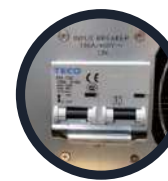
Breaker de entrada