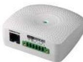
EMD (Dispositivo de monitoreo ambiental) para que pueda operar se necesita tener la SNMP instalada