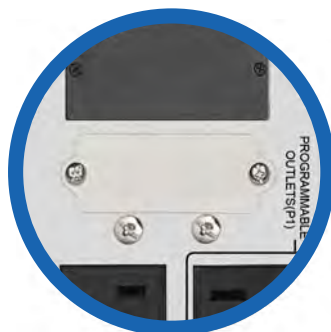
Entrada banco de baterías externas