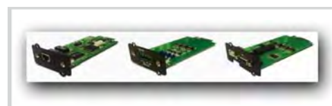
Tarjetas opcionales SNMP y de control