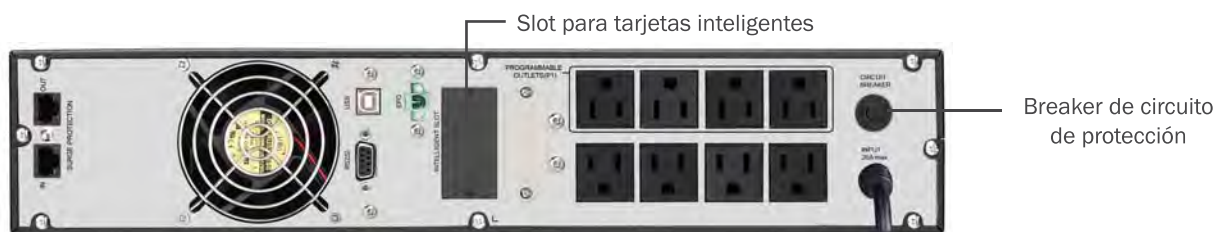
Vista trasera del equipo