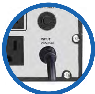
Cable de alimentación CA