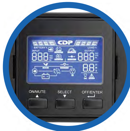
Panel LCD con rotación de 90°