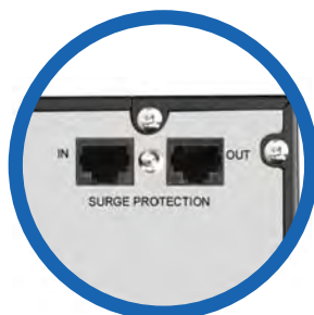
Protección de línea de datos