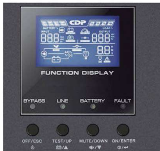
Display LCD Muestra voltajes de entrada, salida, tiempos de autonomía y carga de batería.