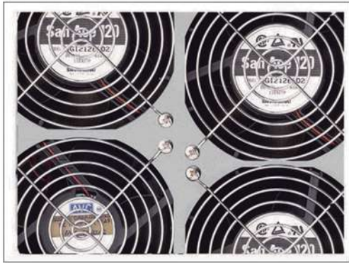
Velocidad de ventiladores controlado por nivel de carga