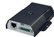
EMD (Dispositivo de monitoreo ambiental) para que pueda operar se necesita tener la SNMP instalada