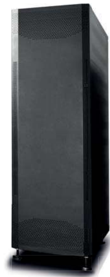
Banco de baterías UPO33HF-BC-8009-20