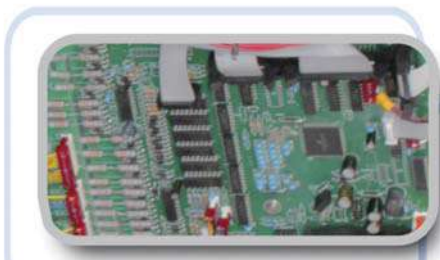
Microprocesador DSC | DSP