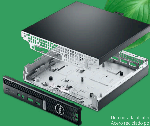
Una mirada al interior: Acero reciclado posindustrial

En OptiPlex nos apasiona reducir la huella de carbono de nuestros productos y ayudar a nuestros clientes a generar un impacto en el futuro. Y es por eso que la OptiPlex Micro es actualmente la PC comercial ultracompacta con la mayor eficiencia energética 1 . Adoptamos un enfoque de diseño circular e innovamos con materiales renovables, embalaje, conservación de energía, reciclaje e incluso capacidad de reparación.