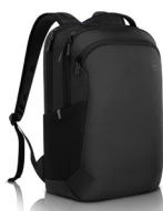
Mochila Dell EcoLoop Pro: CP5723

El adaptador móvil USB-C 7 en 1 compacto y portátil ofrece una magnífica calidad de video, conectividad de datos y transferencia de alimentación de hasta 90 W a la PC.