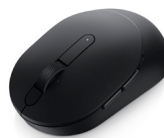
Mouse inalámbrico Dell Mobile Pro: MS5120W negro

Una mochila ecológica que le brindará protección cuando esté en movimiento.