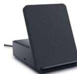
Estación de acoplamiento de carga doble Dell: HD22Q

Optimize las reuniones virtuales: Con una cámara IR emergente integrada, parlantes dobles de 5 W y micrófono con cancelación de ruido, esta pantalla ofrece una colaboración simplificada dondequiera que trabaje.