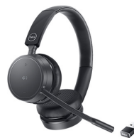
Auriculares inalámbricos Dell Pro: WL5022

Experimente una carga y una conectividad Thunderbolt 4 increíblemente rápidas con esta estación de acoplamiento modular, flexible y potente.