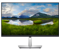
Monitor con concentrador USB-C de 27": P2723DE

Mantenga la productividad sin importar dónde trabaje gracias a este elegante monitor QHD con concentrador de 27" que incluye ComfortView Plus.