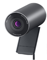
Cámara web Dell Pro: WB5023

Disfrute de la libertad inalámbrica con estos auriculares certificados para Microsoft Teams con Bluetooth. Cámbiese fácilmente a su PC o teléfono inteligente y disfrute de un audio nítido mientras se desliza.