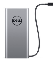
Cargador portátil para laptops Dell Plus USB-C, 65 Wh: PW7018LC

Conecte su mouse de forma conveniente con conectividad Bluetooth o inalámbrica de 2,4 GHz y mejore su productividad con botones de acceso directo programables.