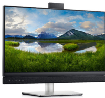
Monitor Dell 24 para videoconferencias: C2422HE

Optimize las reuniones virtuales: Con una cámara IR emergente integrada, parlantes dobles de 5 W y micrófono con cancelación de ruido, esta pantalla ofrece una colaboración simplificada dondequiera que trabaje.