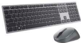
Mouse y teclado inalámbricos Dell Premier: KM7321W

Experimente una carga y una conectividad Thunderbolt™ 4 increíblemente rápidas con esta estación de acoplamiento modular, flexible y potente.