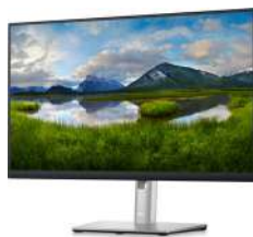
Monitor Dell 24: P2423D

Un revolucionario monitor curvo QHD doble de 34 pulgadas con vistas más amplias, funciones de tareas múltiples y conectividad sin inconvenientes para una experiencia de trabajo inmersiva.