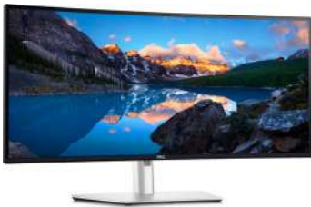
Monitor curvo Dell UltraSharp 34 con centro de conexión Thunderbolt™: U3425WE

Cree su espacio de trabajo ideal con estos accesorios recomendados.