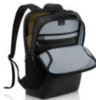
Mochila Dell EcoLoop Pro: CP5723

Experimente características multitarea superiores con un conjunto de teclado y mouse premium elegante y cómodo. Complete sus tareas con la tecnología de una de las duraciones de batería líderes en la industria de hasta 36 meses.*