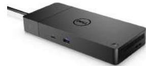
Estación de acoplamiento Dell Thunderbolt™ 4: WD22TB4

Manténgase enfocado con un monitor QHD de 23,8", optimizado para ofrecer detalles y claridad de alto rendimiento.