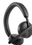
Auriculares inalámbricos Dell – WL3024

La mochila Dell EcoLoop Pro 15, diseñada para garantizar la productividad y la protección en movimiento, se fabrica con material ecológico que complementa bien los estilos de vida ajetreados.