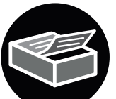
Area de escaneo de 11.7" x 17"