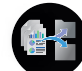
Document Capture PRO