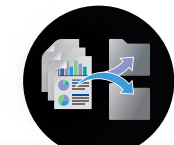
Document Capture PRO