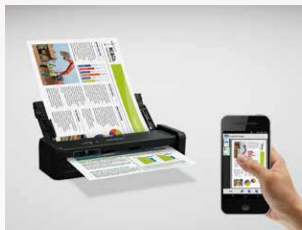
Escanee en forma inalámbrica a su smartphone, tableta o computadora 2