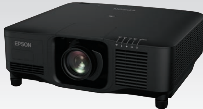
El producto se muestra con lente, los lentes se venden por separado

Brillo en color: 20 000 lúmenes 1 Brillo en blanco: 20 000 lúmenes 1